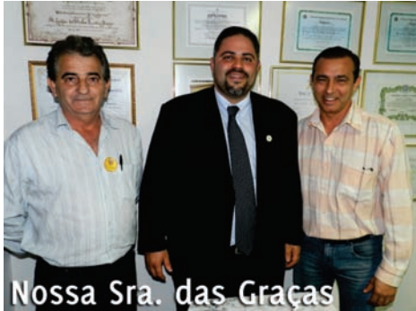
Nossa Sra. das Graças