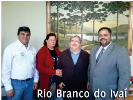
Rio Branco do Ivaí