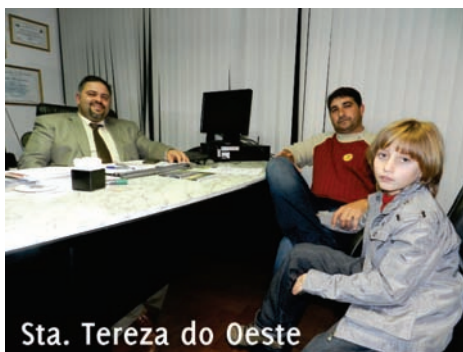
Sta. Tereza do Oeste