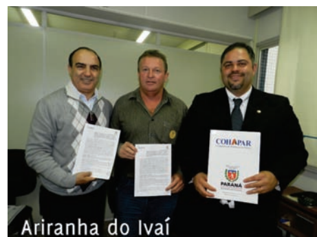
Ariranha do Ivaí