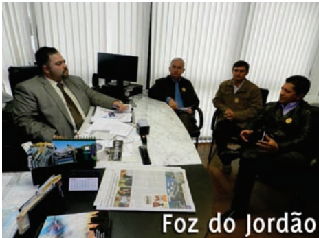
Foz do Jordão