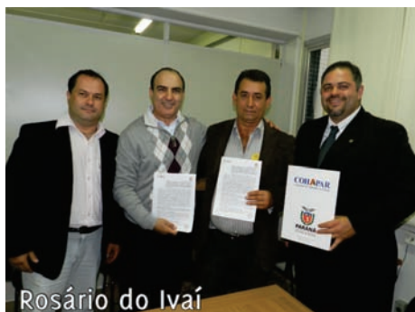
Rosário do Ivaí